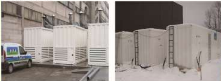
La fábrica de PVC RUIHAO de Mosú, 3 unidades de contenedores( 2250KVA, 400V) de grupos electrógenos de alto voltaje de puesta en paralelo.