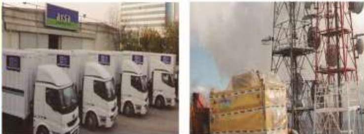
La compañía telefónica de Turguía, 245 unidades de vehículos móviles de electricidad, potencia es 220KVA-600KVA, capacidad total es 54112KVA.