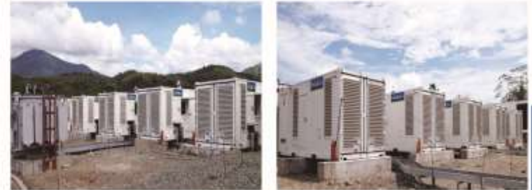
El grupo electrógeno DMC1 de Filipinas, 18 unidades de APD1513M-6, tipo contenedor, de puesto en paralelo.