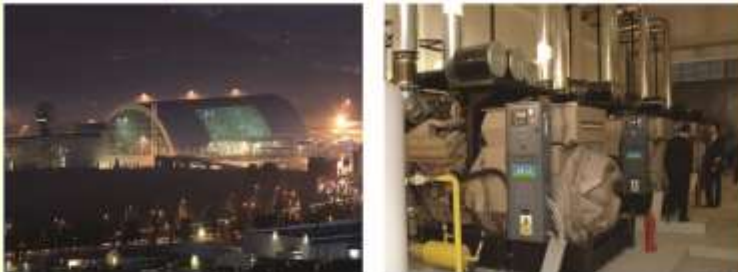
El aeropuerto internacional de Istanbul, 5 unidades de contenedores( 2000KVA, 6.3KV) de grupos electrógenos de alto voltaje de puesta en paralelo.