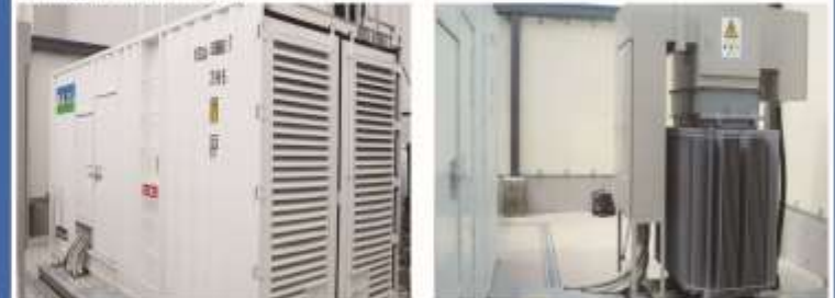
La compañía TORAY de Japón, una unidad de APD1000C, tipo contenedor, se arranca por la operación de conexión.