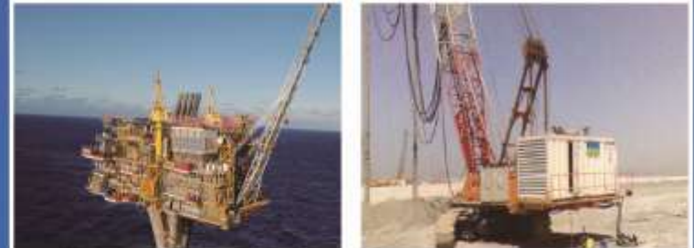
La compañía de petróleo de Dubai, varias unidades de grupos electrógenos se sirven en todos los campos petrolífero de Medio Oriente, potencia es 200KVA-800KVA.