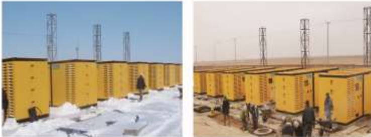
La compañía nacional argentina de electricidad, 20 unidades de contenedores( 800KVA, 10KV) de grupos electrógenos de alto voltaje de puesta en paralelo.