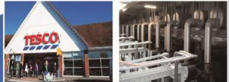
El supermercado de Tesco de Inglaterra, 31 unidades de grupos electrógenos, potencia es 650KVA-1435KVA, capacidad total es 34065KVA.